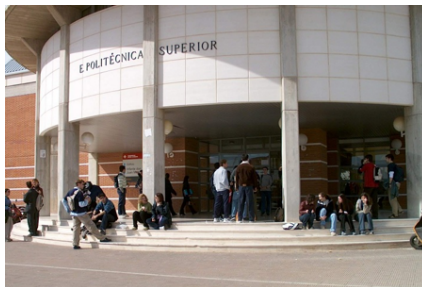
(a) Fotografía de la izquierda

Se incluye el paquete subfigure para la inclusión de figuras con varias imágenes o gráficas, como la que muestra la figura 2.3.