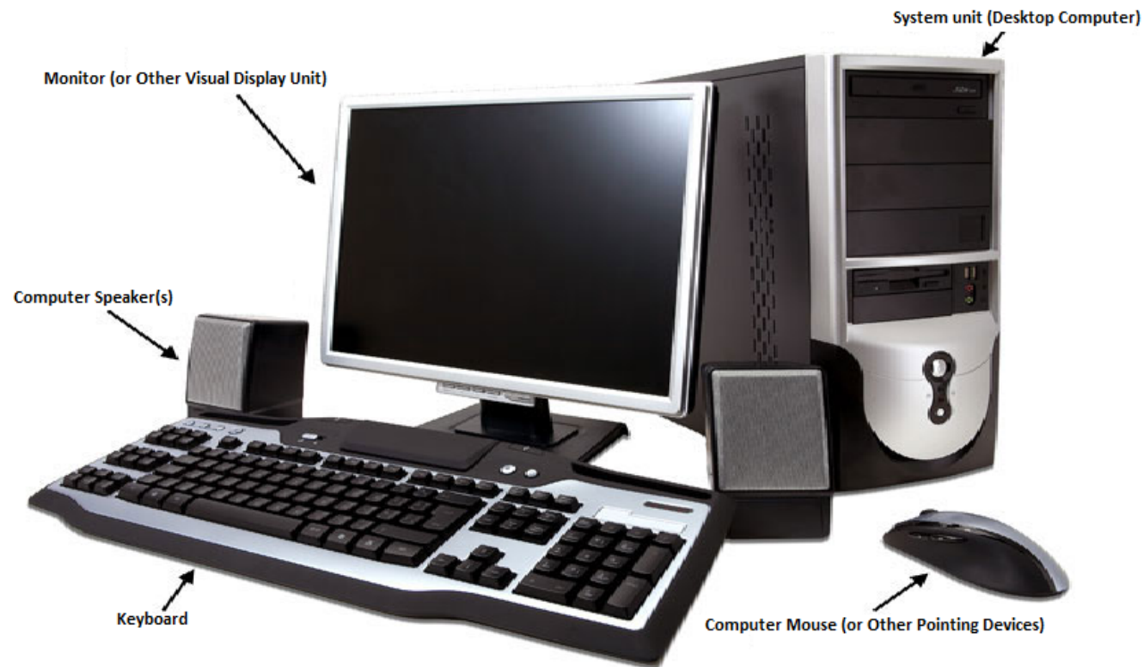
Gambar 4.1 Contoh Gambar Komputer