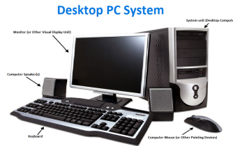
Gambar 3.1 Komputer