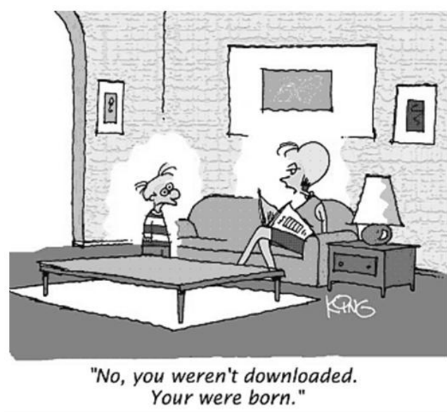
Figura 1. Uma figura típica.