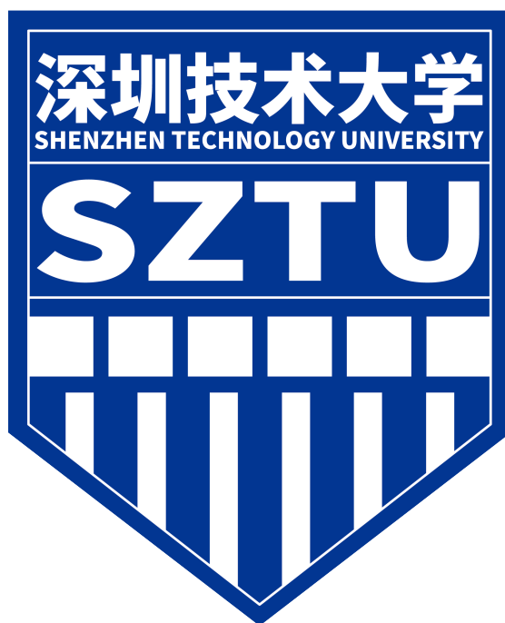
图 2.1 单图布局示例