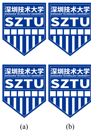
图 2.4 竖排多图横排布局