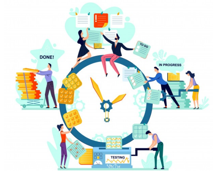
Figura 1.1: TFG