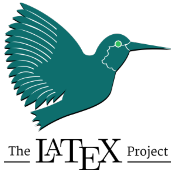
Figura 1: Mi figura uno

Lorem ipsum dolor sit amet, consectetur adipiscing elit. Ut purus elit, vestibulum ut, placerat ac, adipiscing vitae, felis. Curabitur dictum gravida mauris. Nam arcu libero, nonummy eget, consectetur id, vulputate a, magna. Donec vehicula augue eu neque. Pellentesque habitant morbi tristique senectus et netus et malesuada fames ac turpis egestas. Mauris ut leo. Cras viverra metus rhoncus sem. Nulla et lectus vestibulum urna fringilla ultrices. Phasellus eu tellus sit amet tortor gravida placerat. Integer sapien est, iaculis in, pretium quis, viverra ac, nunc. Praesent eget sem vel leo ultrices bibendum. Aenean faucibus. Morbi dolor nulla, malesuada eu, pulvinar at, mollis ac, nulla. Curabitur auctor semper nulla. Donec varius orci eget risus. Duis nibh mi, congue eu, accumsan eleifend, sagittis quis, diam. Duis eget orci sit amet orci dignissim rutrum. (Knuth, 1984)