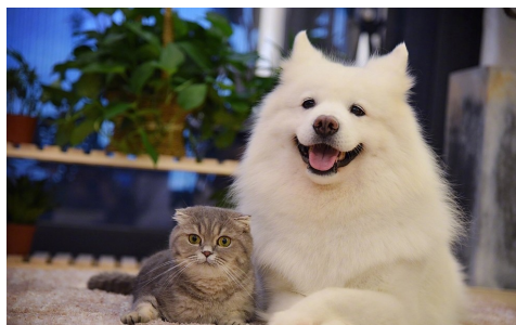
图 2-1 插入一副图