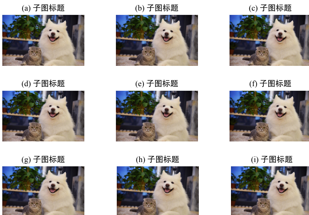
图 2-3 多行多子图