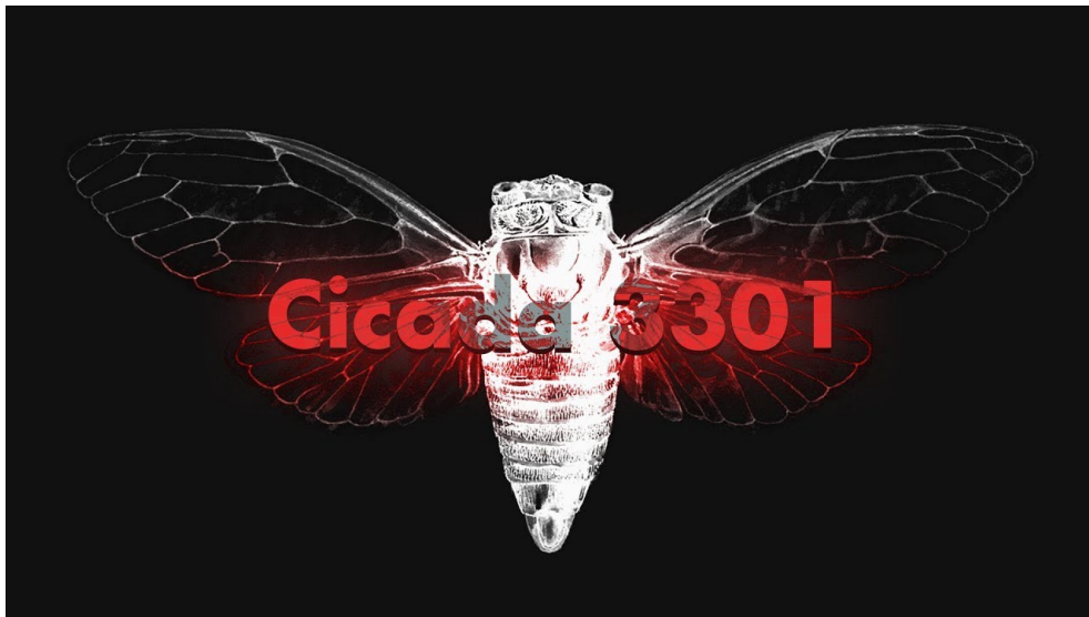
FIGURE 1 – Logo de Cicada 3301