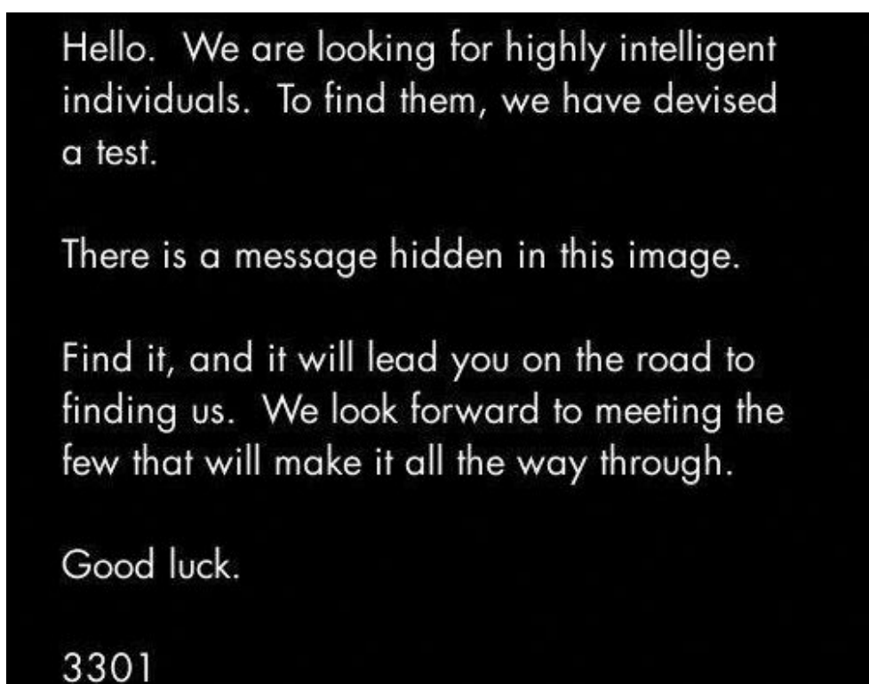
FIGURE 2 – Premier message

La première série fut diffusée le 4 janvier 2012 sur le site 4chan, dédié à la communication par image. En l'occurrence, il s'agissait d'un message simple expliquant :