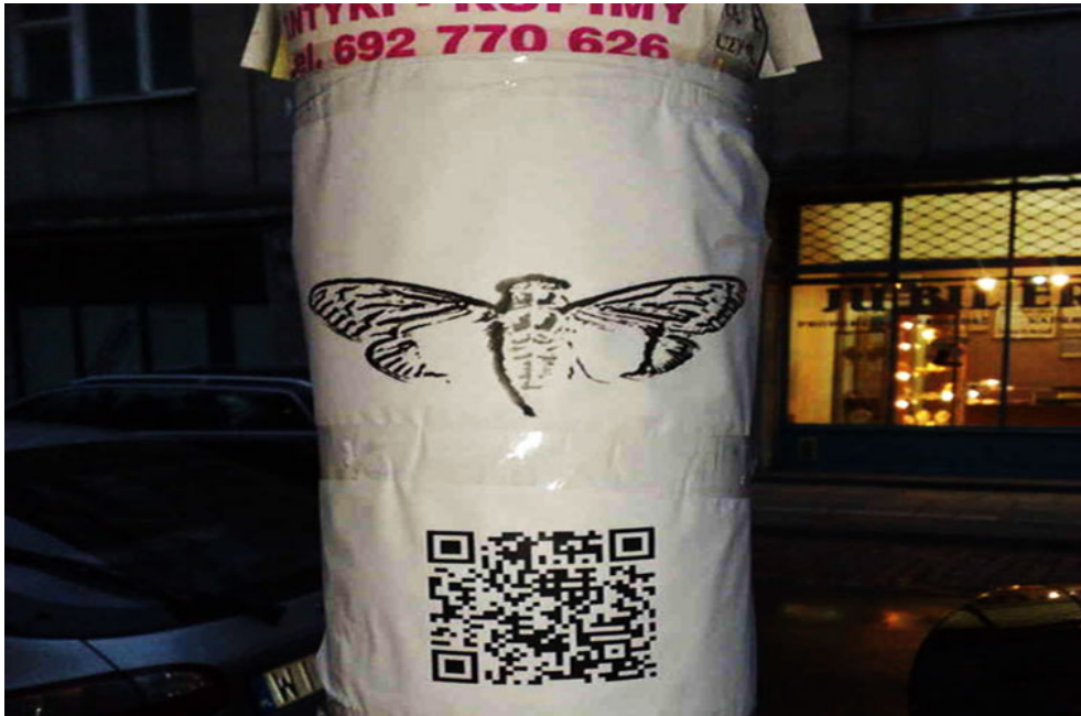
FIGURE 4 – QR Code

Scanner le QR amenait de nouveau à l'image du logo de Cicada 3301, Outguess guide nos pas jusqu'au livre Agrippa , lui-même menant à un lien... Tant d'énigmes similaires à celles précédemment résolues.